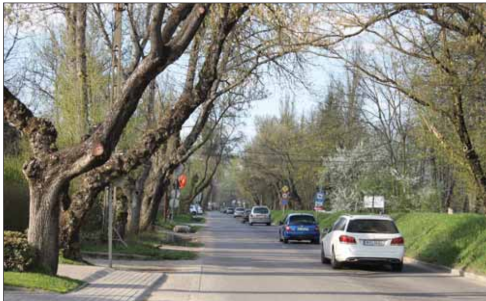
Megmenekülnek a platánok, maradhat a fasor a Nánási úton

A Fővárosi Közgyűlés 2017. április 5-i ülésén 19 igen, 2 nem szavazattal, 4 tartózkodás mellett eldöntötte: a Csillaghegyi-öblözet árvízvédelmét szolgáló védmű a part menti nyomvonalon valósulhat meg. A Csillaghegyi-öblözet minden lakója fellélegezhet, hiszen így mind az 55 ezer itt élő ember biztonságba kerül. A parton a mai elhanyagolt állapotok helyett európai színvonalú, szép és rendezett környezet alakulhat ki. Gyalogos sétány, bicikliút, parkosított játszó-, pihenő és közösségi terek fogadják majd a környékelieket és az ide látogatókat. Ami pedig legalább ennyire fontos: végre nem fog mindenkit rettegésben tartani és pár évente minden értéket tönkretenni, elmosni az egyre magasabban tetőző árvíz.