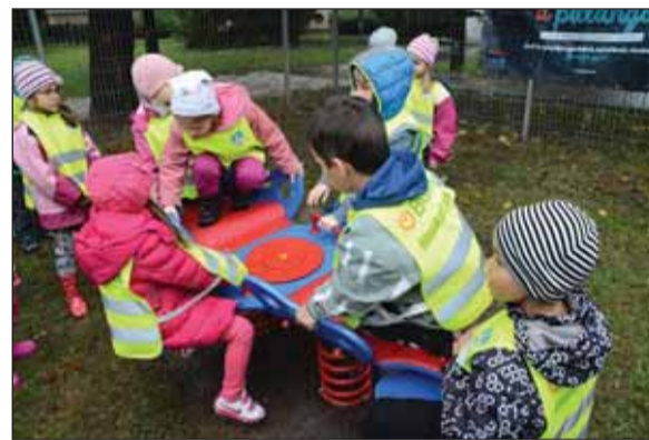
Huszti úti játszótér

ják a fogyatékkal élő társaikat. Megteremti a feltételeket az eltérő fejlődésű, fogyatékkal élő és az ép gyermekek közös játékához. A kerekesszékekben élő, mozgásukban, vagy egyéb képességeikben korlátozott gyerekeknek is biztosítani tudja a játszótér a lehetőséget a játékra, a találkozásra társaikkal. Biztosítja a képességeik, készségeik fejlesztését és az esélyegyenlőséget.