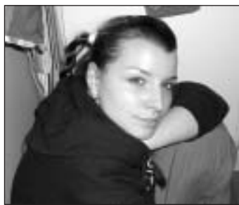
Gigi, a sokoldalú amazon