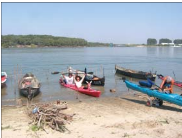
Befutás a Silistrára a kikötőbe. 375 km-re a tengertől