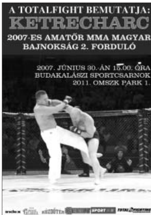
A ketrecharc bajnokság nyári fordulójának plakátja