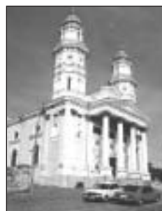
Az ungvári székesegyház

3. nap – Indulás a huszti várrom- hoz – A viski református templom Técső, Kossuth és a Hollósy szo- bor, református templom Európa közepe Rahónál