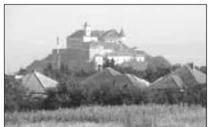
A munkácsi vár

5. nap – Városnézés Beregszászban A Bethlen kastély – Megérkezés Budapestre a késő esti órákban.